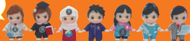
※希望学部のストラップを1つ差し上げます。